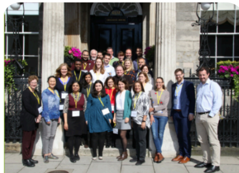
Améliorer l'accès à la santé mentale des jeunes ensemble

Des responsables de services intégrés pour la jeunesse du monde entier se sont réunis, notamment headspace (Australie), Jigsaw (Irlande), ease (Pays-Bas), Maison des adolescents (France), Youth One Stop Shops (Nouvelle-Zélande), CHAT (Singapour), Coolminds. (Hong Kong), Norfolk Youth Service (Royaume-Uni) et deux autres grandes initiatives de services aux jeunes au Canada: Foundry (Canada) et YWHO (Canada).